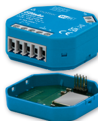
Serie 64-IPM con l'adattatore Enocean EOA64